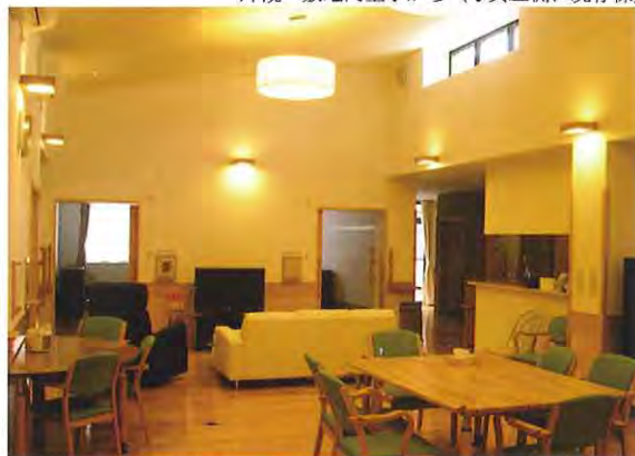
共同生活室 ハイサイドライトから光が降り注ぎます