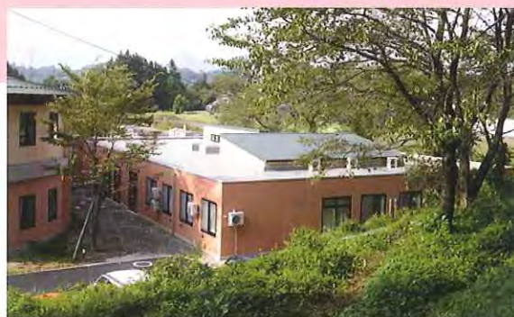
外観 敷地内土手から (写真左側に既存棟)

事業者：社会福祉法人なごみの杜 建築面積：646㎡ 建設地：群馬県利根郡昭和村 延床面積：646㎡ 敷地面積：9,207㎡ 施工：沼田土建(株) 用途：特別養護老人ホーム 工期：6ヶ月 構造規模：S造平屋建 竣工：平成22年9月末 業務：設計・監理