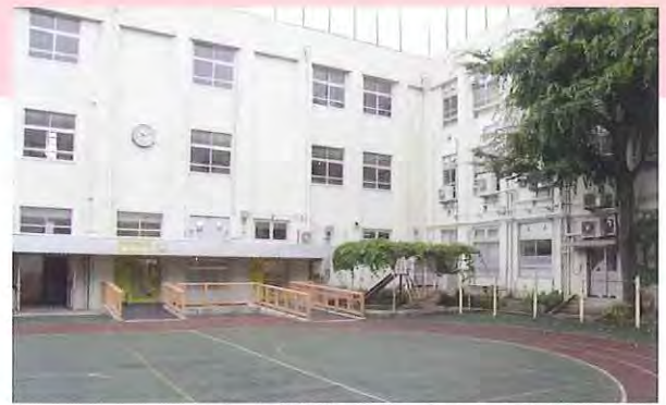
外観 病後児用と事業所用で入口が分かれています

内装はフレーベル館の好意によりアンパンマンのキャラクターの壁画を寄贈いただいて、子どもたちにとって、楽しい保育所ができました。