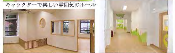
キャラクターで楽しい雰囲気のホール