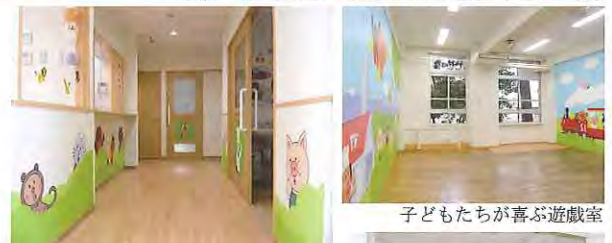
子どもたちが遊ぶ遊戯室