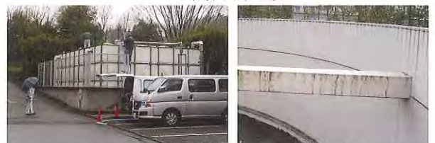
外壁、設備機器等を目視や打診などで調査を行いました